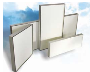
Alla varianter från H11 till U17

stephen@resema.se magnus@resema.se jan.mottlau@resema.se anders@resema.se alt. via www.resema.se