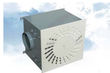
Nyhet: Komplet HEPA sortiment